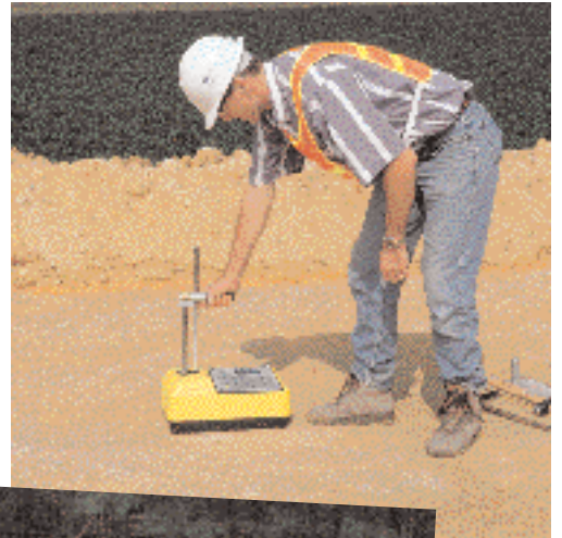
Suelos y capas granulares.

Un densímetro nuclear para una nueva era.