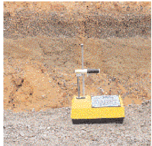
El RoadReader™ Plus es versátil, rápido y económico.