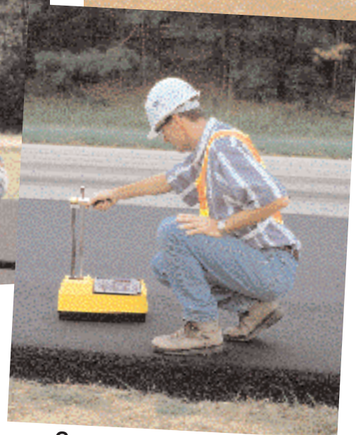
Capas asfálticas gruesas y losas de concreto hidráulico.