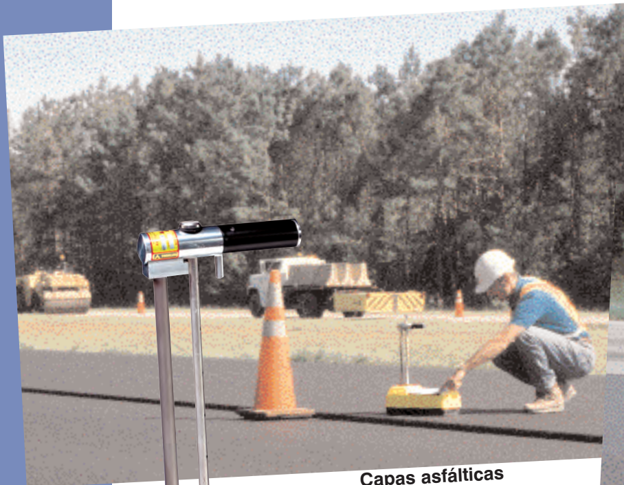
Capas asfálticas delgadas y sobrecapas de concreto hidráulico.